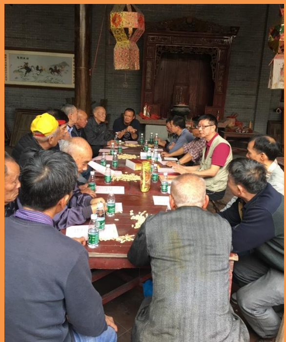
2019 年 1 月 19 日重修族譜編委會會議